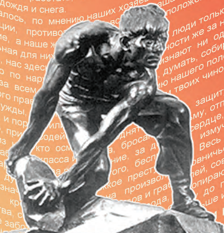
обложка Э. Ракитской